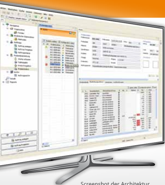
Screenshot der Architektur